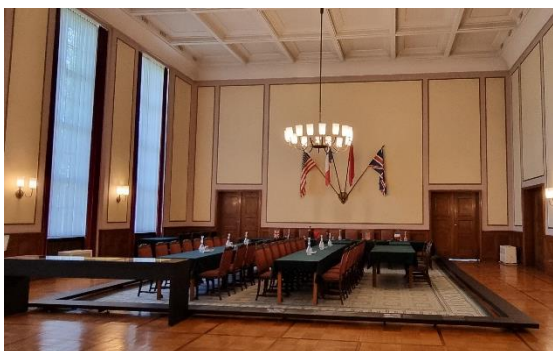
Foto: Der Kapitulationssaal. Museum Berlin-Karlshorst

Первым местом стал Museum Berlin-Karlshorst – историческое здание, где в ночь с 8 на 9 мая 1945 года был подписан Акт о капитуляции Германии. Этот момент ознаменовал окончание Второй мировой войны в Европе и победу над национал-социализмом. Экскурсия по музею произвела на учеников сильное впечатление. Они побывали в зале подписания капитуляции и узнали о трагических событиях и ужасах войны 1939–1945 годов.